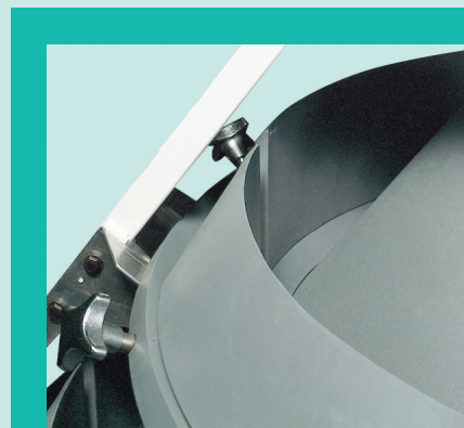
Canali teflonati regolabili manualmente Manually adjustable teflon coated channels Canaux teflonisés réglables manuellement Teflonbeschichtete Rinnen, manuell regulierbar Canales teflonados regulables manualmente